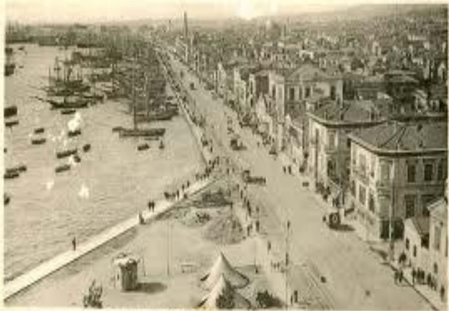
THE PHOTO 3275 - SAN FRANCISCO - Perspective from the Cliff at the Battery